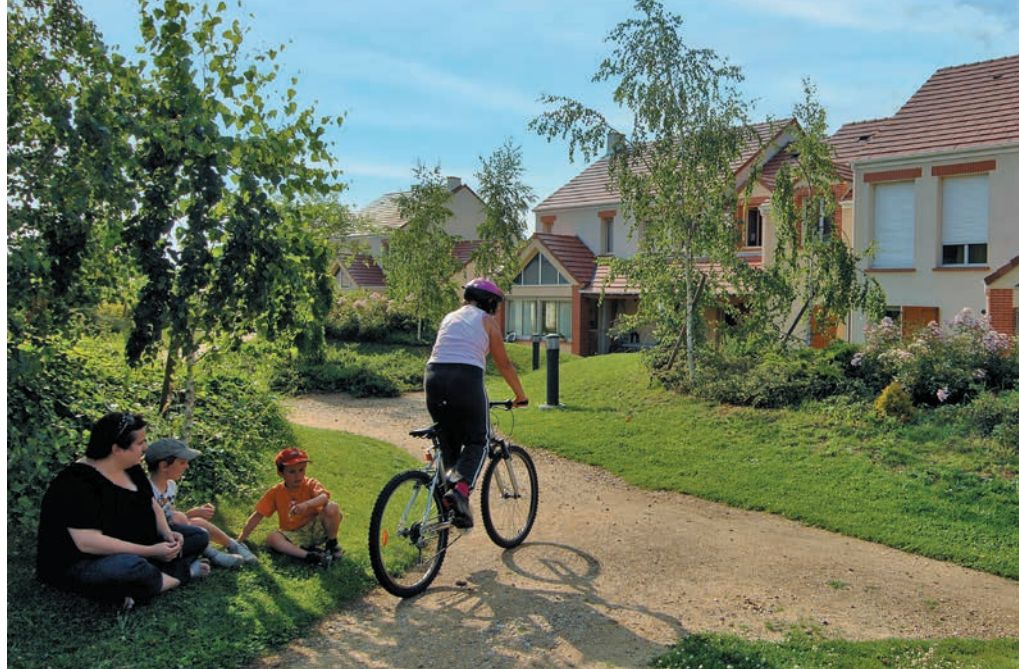
Village ACTION ENFANCE d'Amilly (45).